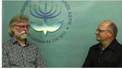
Die NG Kerk en Teologiese Opleiding – Frederick Marais: Kliek hier