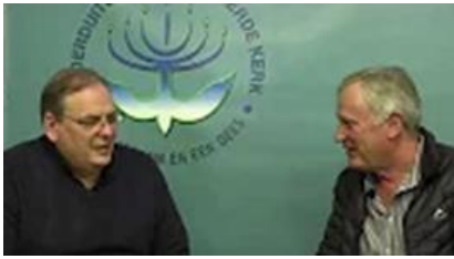
Christus het opgestaan – Marius Nel: Kliek hier .