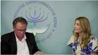
Gereformeerde Skrifbeskouing en hantering – James Kirkpatrick: Kliek hier