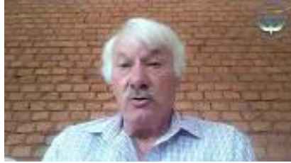
Geskiedenis van “regsinnigheid” sowel as “vroomheid” in die NG Kerk – André Olivier: Kliek hier