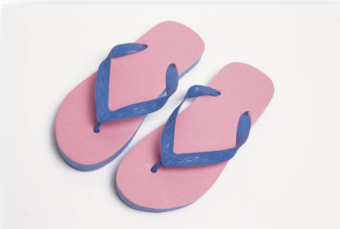
flip-flops / plakkies