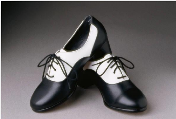
Dansskoene; Fred Astaire; Mafia