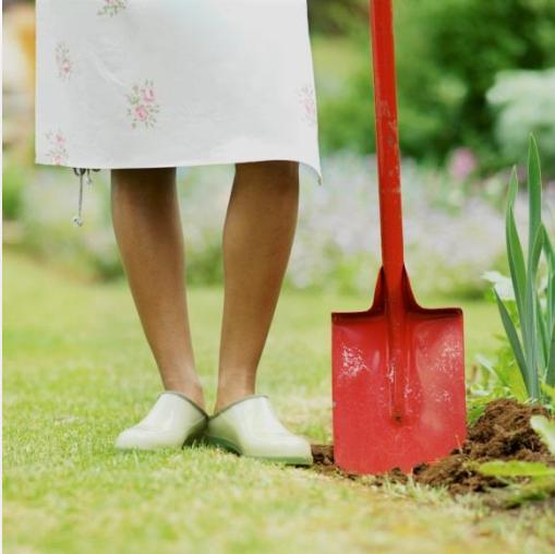
Tuinwerkskoene / Kroks