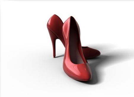
fancy kantoor- of uitgaanskoene